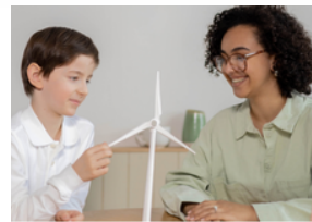
Entendiendo el desarrollo emocional de tu hijo: 5 a 10 años de edad

Una rueda de sentimientos puede ayudar a los niños a identificar sus emociones con más precisión, fomentando autoconciencia y comunicación efectiva mientras navegan las relaciones en sus vidas